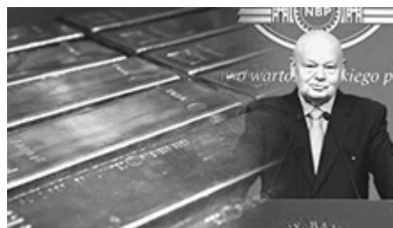
Prof. Adam Glapiński mówi o rezerwach złota

Dementuję stanowczo. Polska nie zamierza ani uszczuplać rezerw dewizowych - w tym złota - ani się pozbywać części, ani całości tych rezerw - powiedział w czwartek prof. Adam Glapiński. Prezes NBP dodał,