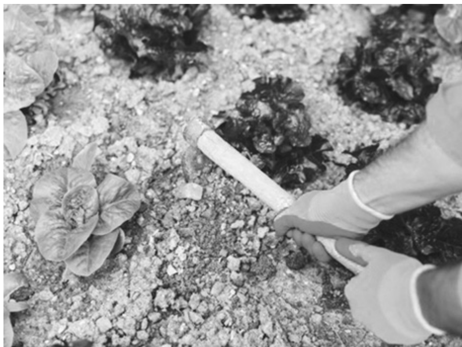
To najlepszy moment na start warzywnika – dobrze przygotowana gleba i właściwy siew w połowie kwietnia decydują o jakości plonów przez cały sezon

Warzywniku nie chodzi o to, żeby zrobić jak najwięcej – tylko żeby zrobić to we właściwym momencie. Połowa kwietnia to właśnie taki punkt, w którym wszystko zaczyna mieć sens: gleba przestaje być zimna, wilgoć pozimowa jeszcze się utrzymuje, a rośliny mają szansę wystartować bez stresu. Z mojego doświadczenia wynika, że jeśli dobrze wykorzystam ten moment, reszta sezonu jest po prostu łatwiejsza.