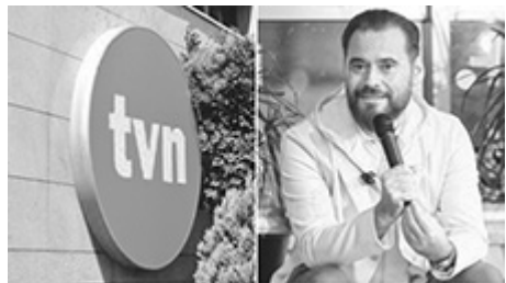
Logo TVN i Krzysztof Stanowski

Krzysztof Stanowski przekonywał, że maksymalnie o dwa miesiące opóźni się start Kanału Zero TV, a tymczasem nie ma żadnych nowych wieści w tej sprawie. KRRiT wyjaśniła co z potencjalną utratą koncesji.