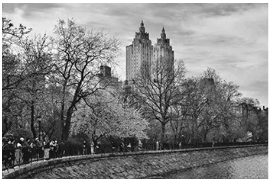
Central Park wiosną