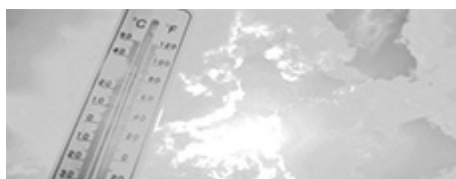
Pogoda lato 2026