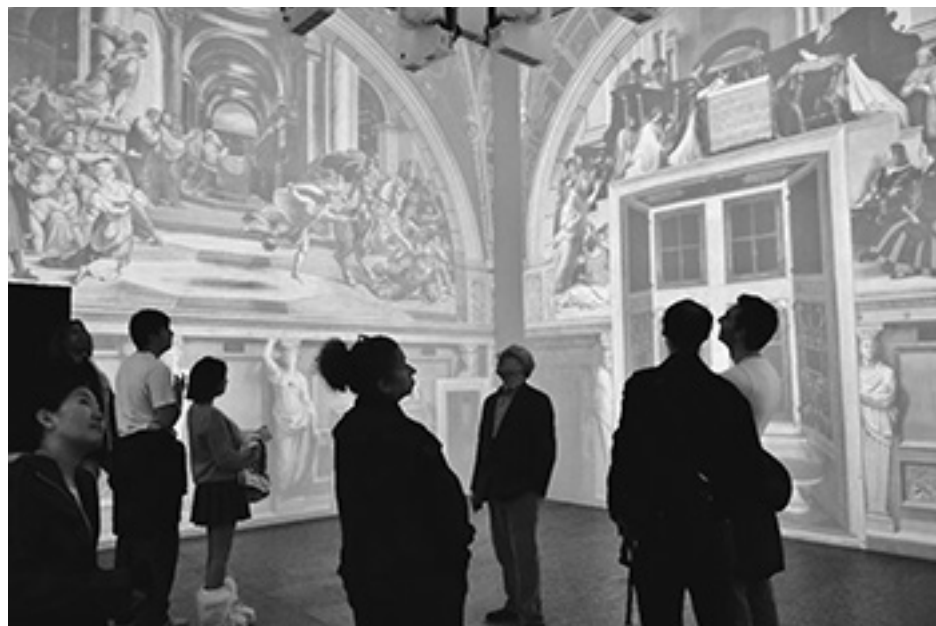
Na ścianach jednej z sal wystawy, wyświetlane są freski, które Raphael malował w Watykanie w kolejnych pomieszczeniach; Stanza della Segnatura, Stanza di Eliodoro, and Stanza dell'Incendio. Można dzięki temu zobaczyć skalę jego pracy w ciągu tych niewielu w sumie lat, w trakcie których realizował zamówienia dwóch papieży