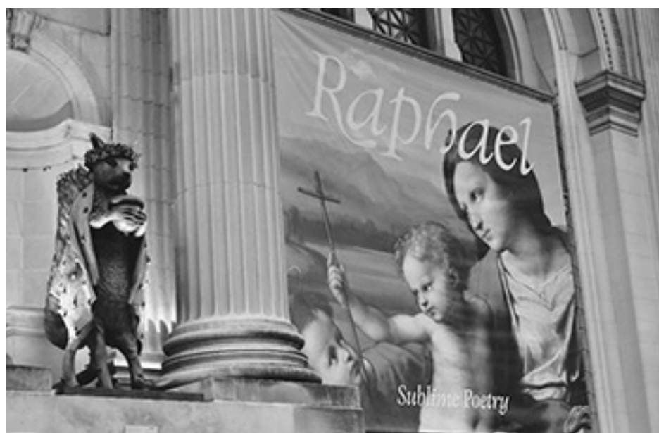
Baner reklamujący wystawę

Efezu- urodzony ok. roku 540 p.n.e - był znakomitym filozofem, do dziś dzięki niemu możemy rozmyślać w nie najlepsze dni że- w dużym uproszczeniu- „wszystko płynie“, oraz, że tylko zmiana jest stała. Ale był też człowiekiem. Aroganckim. Zgrzyliwym. Ludzi dzielił na kompletnych głupców i głupich marzycieli. Swojej niecierpliwości i pogardy dla jednych i drugich nie ukrywał. I to tak bardzo, że zaczął porozumiewać się wyłącznie za pomocą enigmatycznych zagadek.