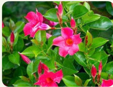
MANDEVILLES - KWIATY TROPICALNE