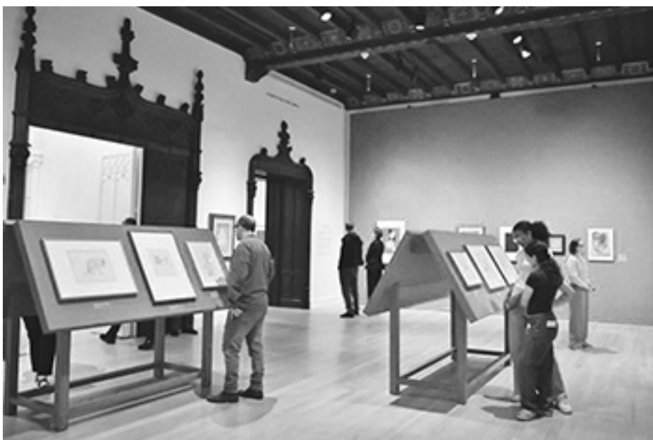
Fragmenty wystawy prac Klee w Jewish Museum przy 5th Avenue