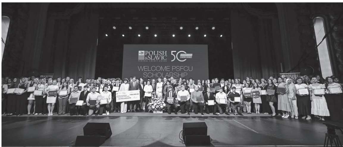
Centrum Kopernikowskie, Chicago