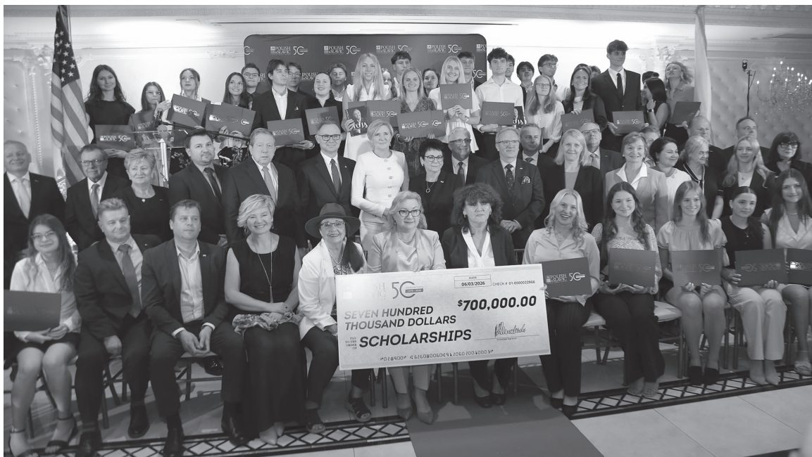
The Grand Ballroom w Totowa, New Jersey

Program Stypendialny PSFCU składa się z dwóch komponentów: programu dla absolwentów szkół średnich oraz dla studentów szkół wyższych. Ogółem w obydwu programach Nasza Unia przyjęła aż 879 wniosków o stypendia, co stanowi kolejny rekord w historii programu stypendialnego PSFCU.