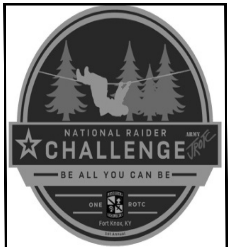
National Raiders Challenge Logo

porque es mi primera vez entrenando con Raiders y asistiendo a competencias,